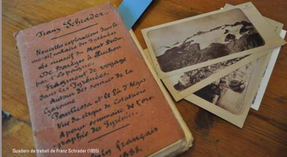
Quadern de treball de Franz Schrader (1855)