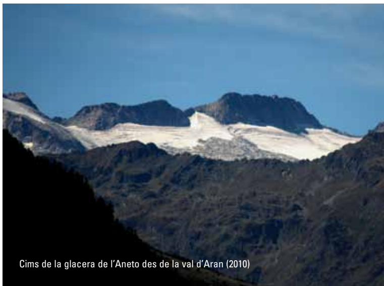
Cims de la glacera de l'Aneto des de la val d'Aran (2010)