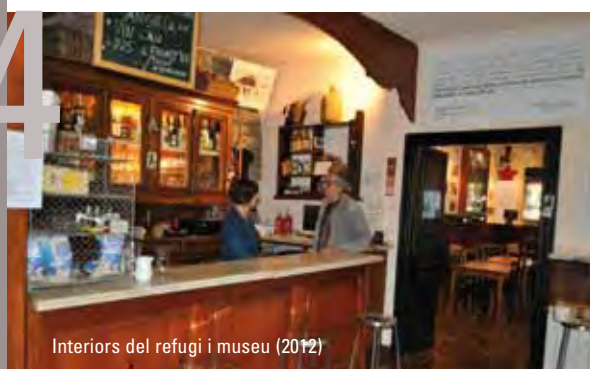
Interiors del refugi i museu (2012)