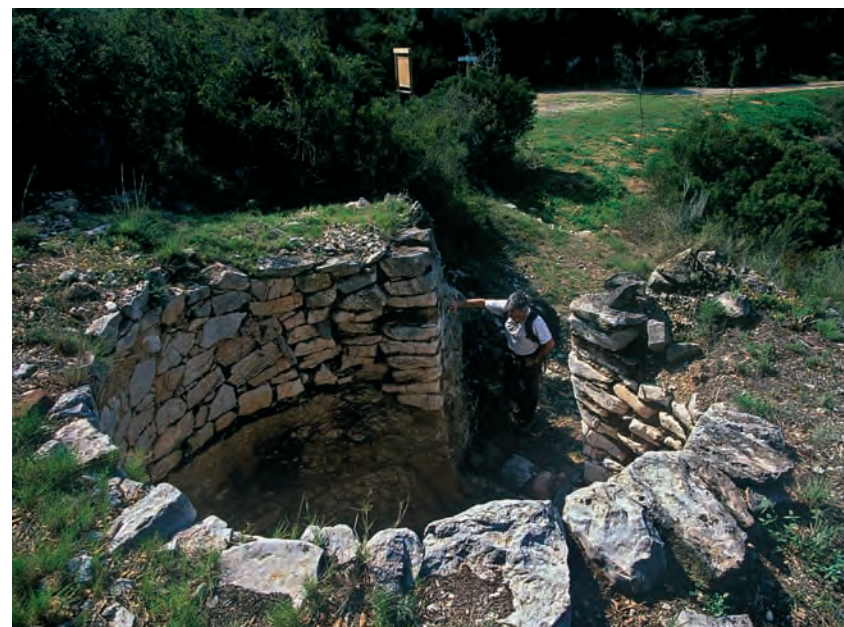
El forn de calç sobre el corral de Pedro