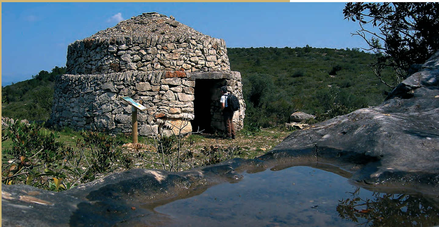
La barraca de Quicolis