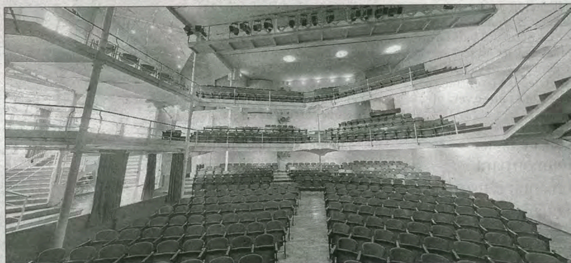
► Imagen del interior del teatro Metropol, de Tarragona.

rámicas dinámicas de Tinet a través de la página principal del portal web ( www.tinet.cat ). Se tra-