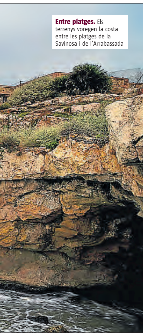
Entre platges. Els terrenys voregen la costa entre les platges de la Savinosa i de l'Arrabassada