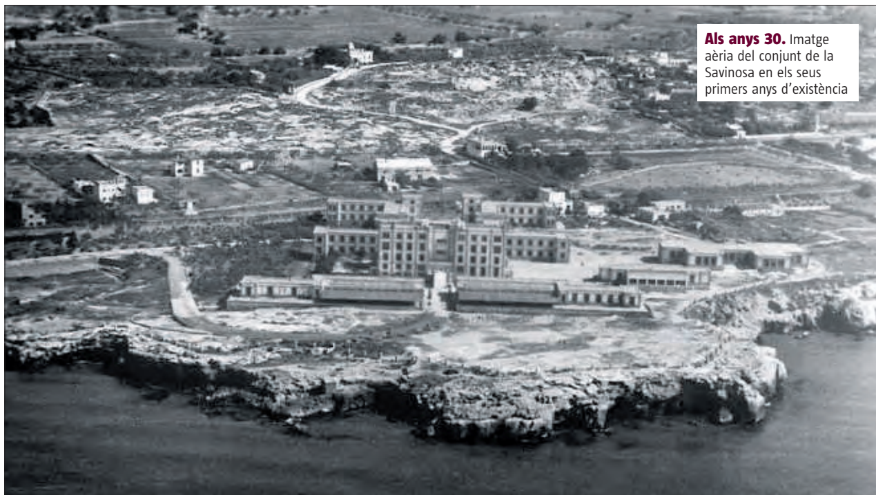
Als anys 30. Imatge aèria del conjunt de la Savinosa en els seus primers anys d'existència

■ L'antic sanatori antituberculós ocupa una superfície de 77.821 metres quadrats al morrot de la Savinosa, un promontori rocós situat entre la platja que porta aquest nom i la de l'Arrabassada, al terme de Tarragona. Adquirida per l'extinta Mancomunitat de Catalunya, la finca va ser gestionada per l'Estat. L'any 1971 la Diputació de Tarragona va recuperar la propietat del recinte, que compta amb cinc edificis i un volum construït de 21.000 metres quadrats.